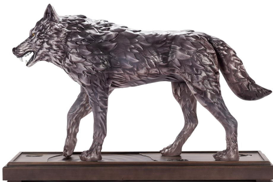
Рис 1. Пример выданного

Эскизы выдаются каждому участнику распечатанными на листе бумаги, необходимо доработать эскиз с учетом задания, анималистическая скульптура должна стать прототипом робота-животного, необходимо проявить технические и художественные компетенции в разработке эскиза.